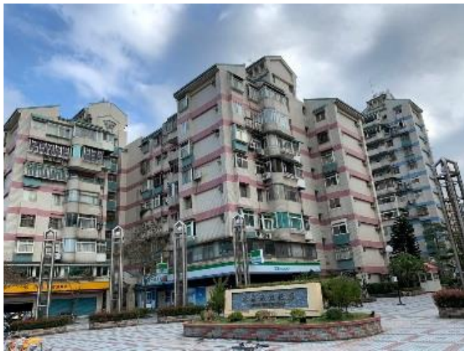
大直美堤國宅共一千多戶，全部都在地下室。

本公司之通信模組裝設在內湖，大直，蘆竹，八德等地。通信成功率高達99.7%。尤其內湖園區所有科技大廠之廠辦大樓，內湖及大直之豪宅，不僅電表均在地下室，且很多都是鋼骨結構，牆壁樓地板也比一般建物厚很多。因此通信難度應是全台最高。足以證明本公司之技術可適用於全台所有地形地物。