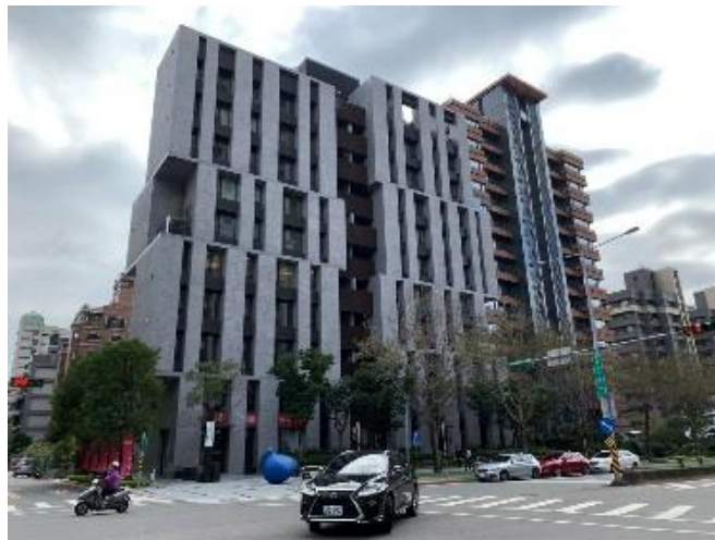
內湖豪宅，電表均在地下室。