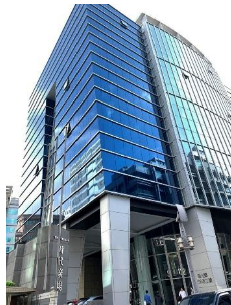
內湖園區科技廠辦，電表均在地下室。